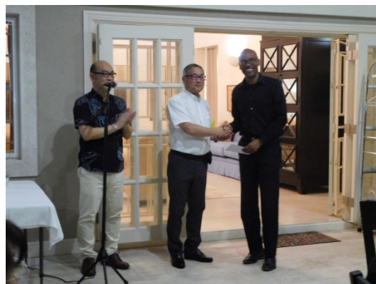
大使公邸におけるレセプションで左から品田大使、握手を交わす大沼豊広・南陽市副市長とジェフ・ウィルチャー・バルバドス創造的経済・文化・スポーツ省次官