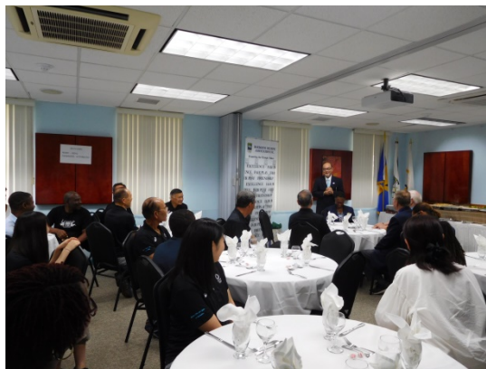
バルバドスオリンピック協会での昼食会で挨拶する品田大使